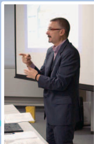
第14回研究会より コリン・アレン 世界ろう連盟理事