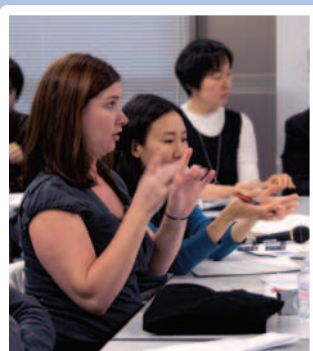
オーストラリア手話→ 英語→日本語へのリレー