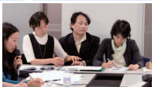
東京大学先端研 福島智教授 指点字通訳者と共に