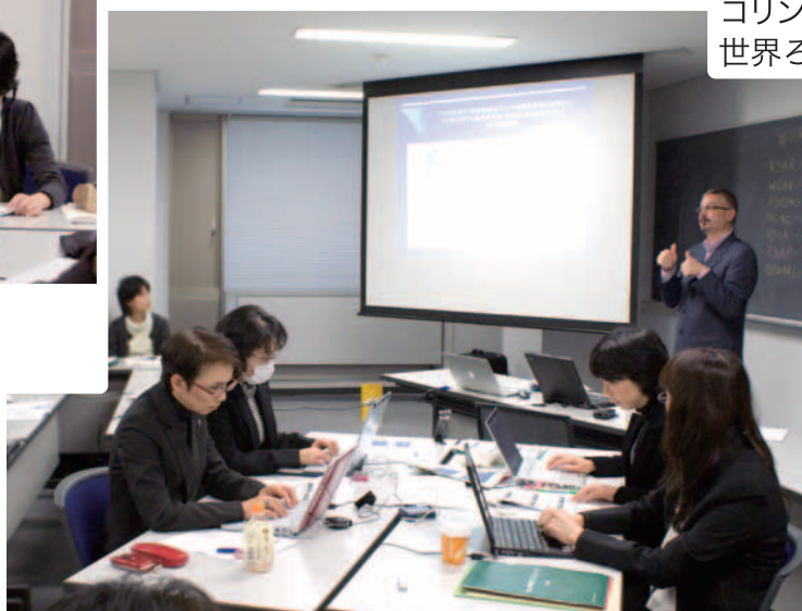
PC 要約筆記 『ユビキタス』